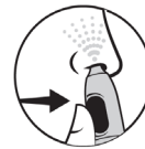
4. Tryk på knappen