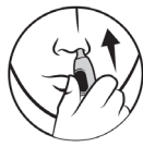
3. Før ind i næsen