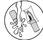
5. Rengør og tør af