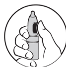
2. Tommelfingeren på knappen