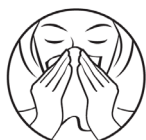
1. Puds næsen