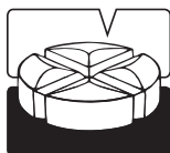
Tablet, der kan deles.

Ikke alle pakningsstørrelser er nødvendigvis markedsført.