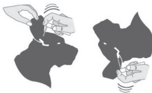
Uanset flaskens position

Som præsenteret gør produktet det muligt at behandle hunde, der lider af bilateral øregangsbetændelse.